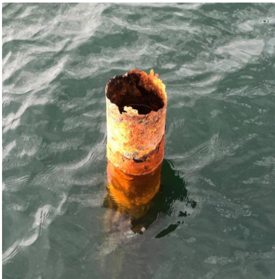
Figur 1: Tæret rør ved E-broen

Samtidig med Covid-19's indtog i Danmark tilkom der havnen en ekstra ubehagelig overraskelse. I løbet af vinteren var en pæl på ydersiden af E-broen knækket under et blæsevejr. Det gik ud over den pågældende båd og E-broen. At en ca. 15 år gammel stålpæl knækker, skærper fokus på alle øvrige pæle fra samme projekt. Efter en stikprøvekontrol viste det værst tænkelig scenarie sig at være et faktum - pælene var alle mere eller mindre gennemtæret med fare for at knække ved næste blæsevejr. Med sæsonen tæt på start og en søsætning af både, der allerede var påbegyndt, var det nødvendigt at handlede hurtigt.